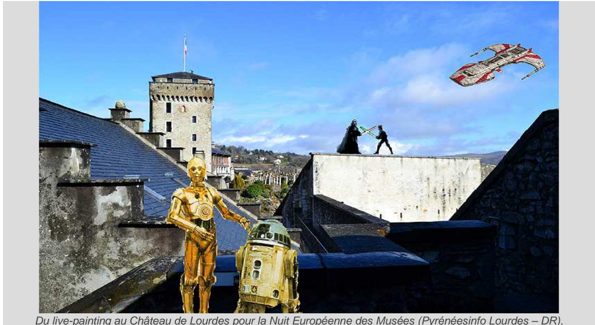
Du live-painting au Château de Lourdes pour la Nuit Européenne des Musées.

DANS PYRENEESINFO LE 14 MAI 2013 À 18 H 06 MIN /